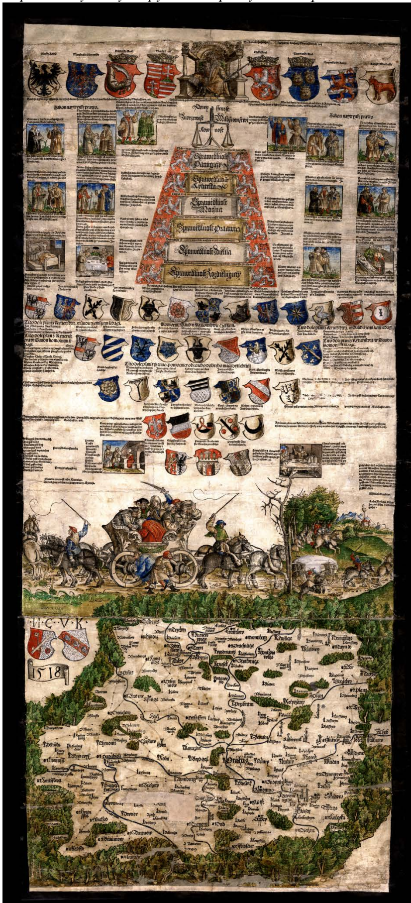
Kopii Klaudyánovy mapy laskavě poskytlo Biskupství litoměřické.